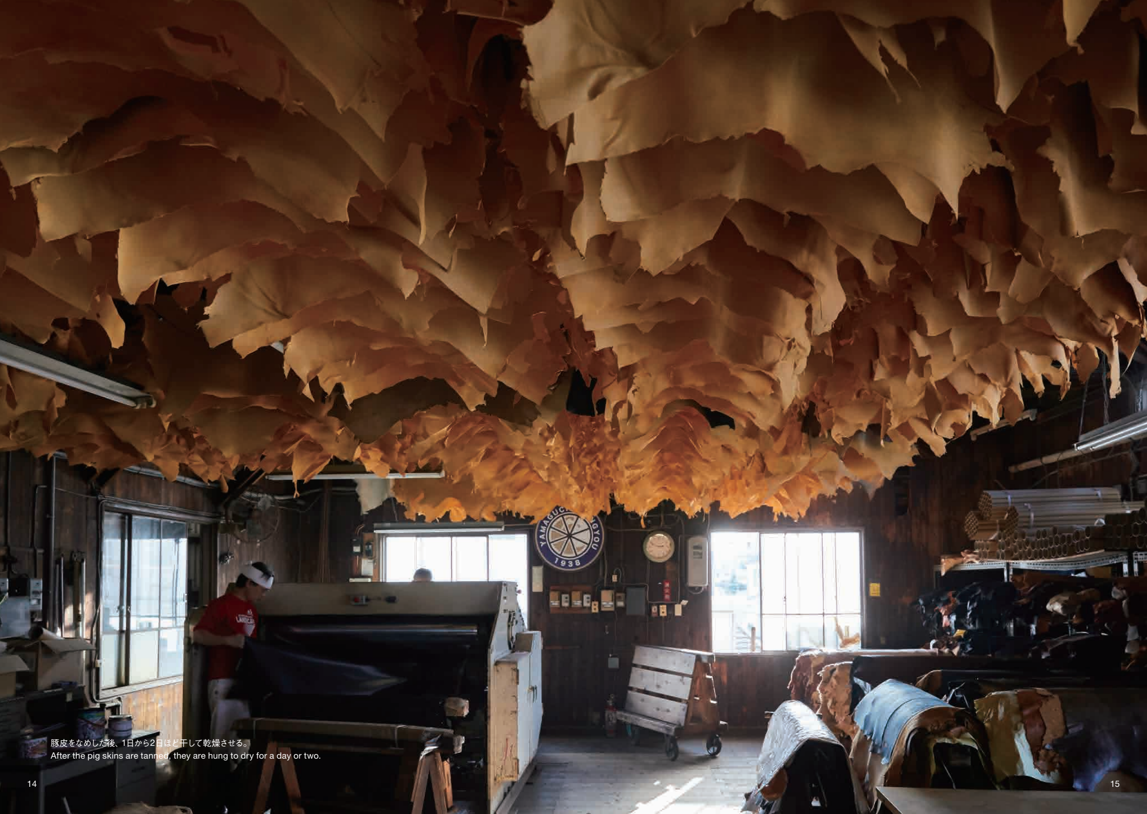
豚皮をなめした後、1日から2日ほど干して乾燥させる。 After the pig skins are tanned, they are hung to dry for a day or two.