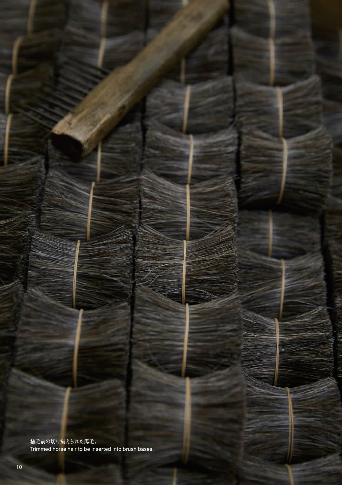
植毛前の切り揃えられた馬毛。 Trimmed horse hair to be inserted into brush bases.