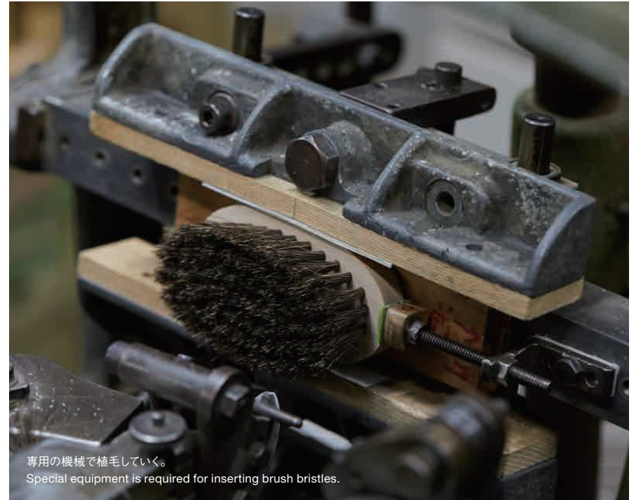
専用の機械で植毛していく。 Special equipment is required for inserting brush bristles.