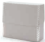
[02484767] フラップ・A5サイズ・小 約幅24×奥行8×高さ21cm 税込 1,290円