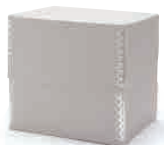
[02484774] フラップ・A5サイズ・大 約幅24×奥行18×高さ21.5cm 税込 1,490円