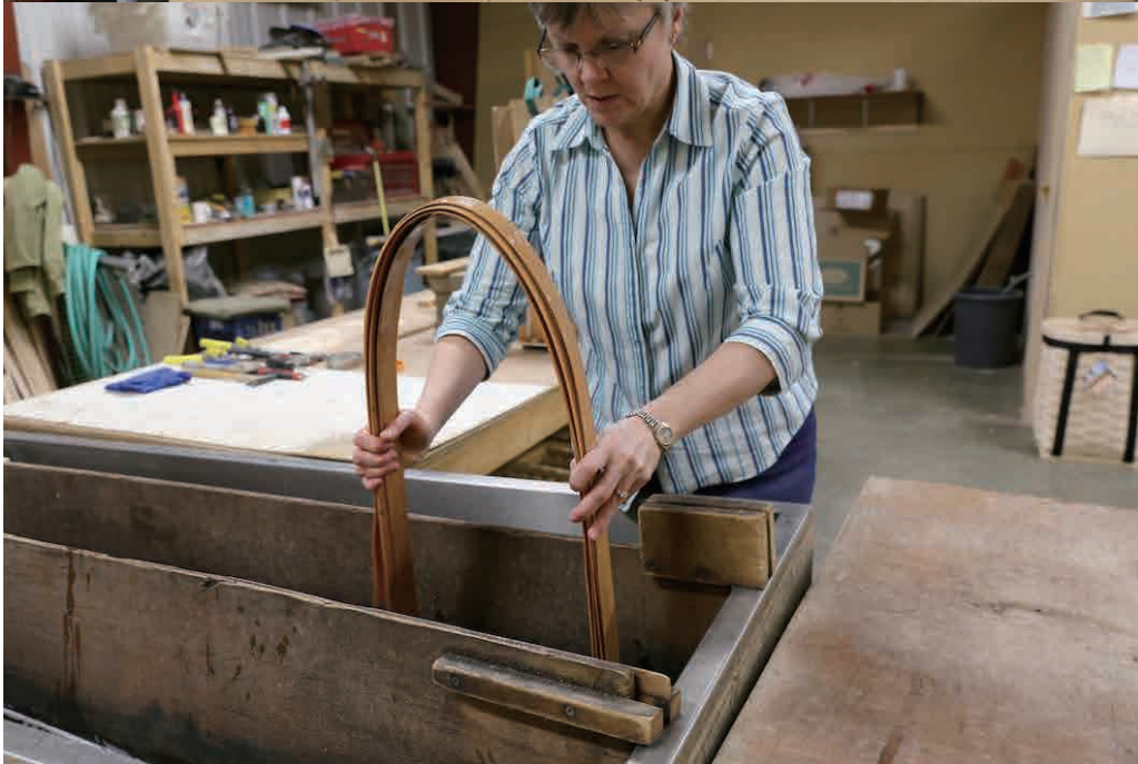
細長くカットしたメイプルの板を水に浸けやわらかくし、土台を固定して型枠をはめ込み込みます。 乾燥すると驚くほど軽くて頑丈な背負いかごとなります。