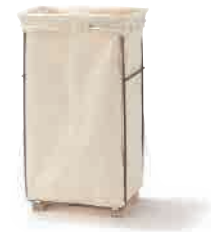
スチールキャンバスランドリーバスケット

* [02484651] 大 約幅64×奥行49×高さ71cm 税込 19,000円