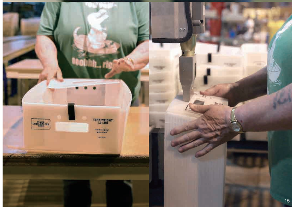
(上) 新しい原料とリサイクルされる粉碎原料。 (下) 折り目に沿って折り曲げ、熱で溶かして接着する、というシンプルな工程。 Top: The raw materials compared with used materials, crushed and ready for recycling. Bottom: Assembly is simply a matter of folding along perforated lines and heating the surfaces to weld them together.