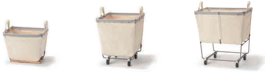
スチールキャンバスバスケット