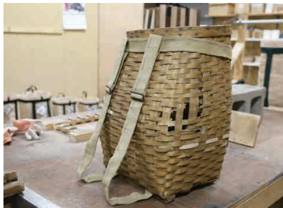
もともと作られていたアッシュの木製のバスケット。 A basket made from ash, the material from which these type of baskets were originally crafted.

Maine shares its border with Canada, where maple is a common material. Here, maple baskets are used for many purposes: when harvesting vegetables, hunting in the forest, collecting mushrooms, nuts and berries as well as for holding tools needed for ice-fishing.