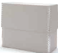
[02484781] フラップ・A4サイズ 約幅32×奥行13×高さ27cm 税込 1,490円