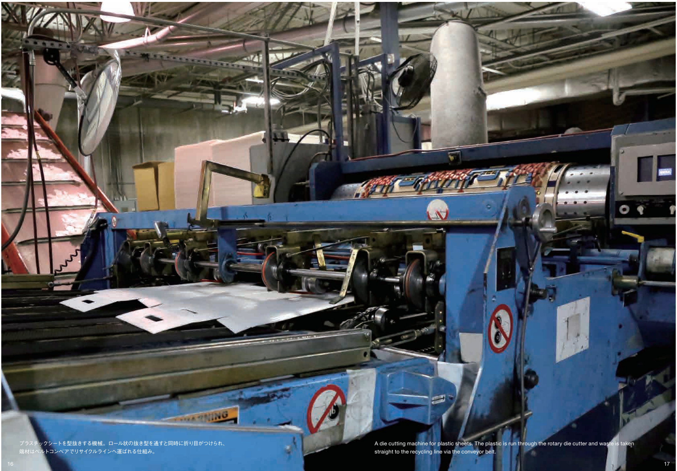
プラスチックシートを型抜きする機械。ロール状の抜き型を通すと同時に折り目がつけられ、端材はベルトコンベアでリサイクルラインへ運ばれる仕組み。