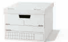
[37189263] 約幅34.5×奥行41×高さ26.5cm 税込 1,000円