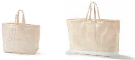
キャンバスバスケット・生成

* [02484668] 約幅40×奥行26×高さ72cm 税込 12,000円