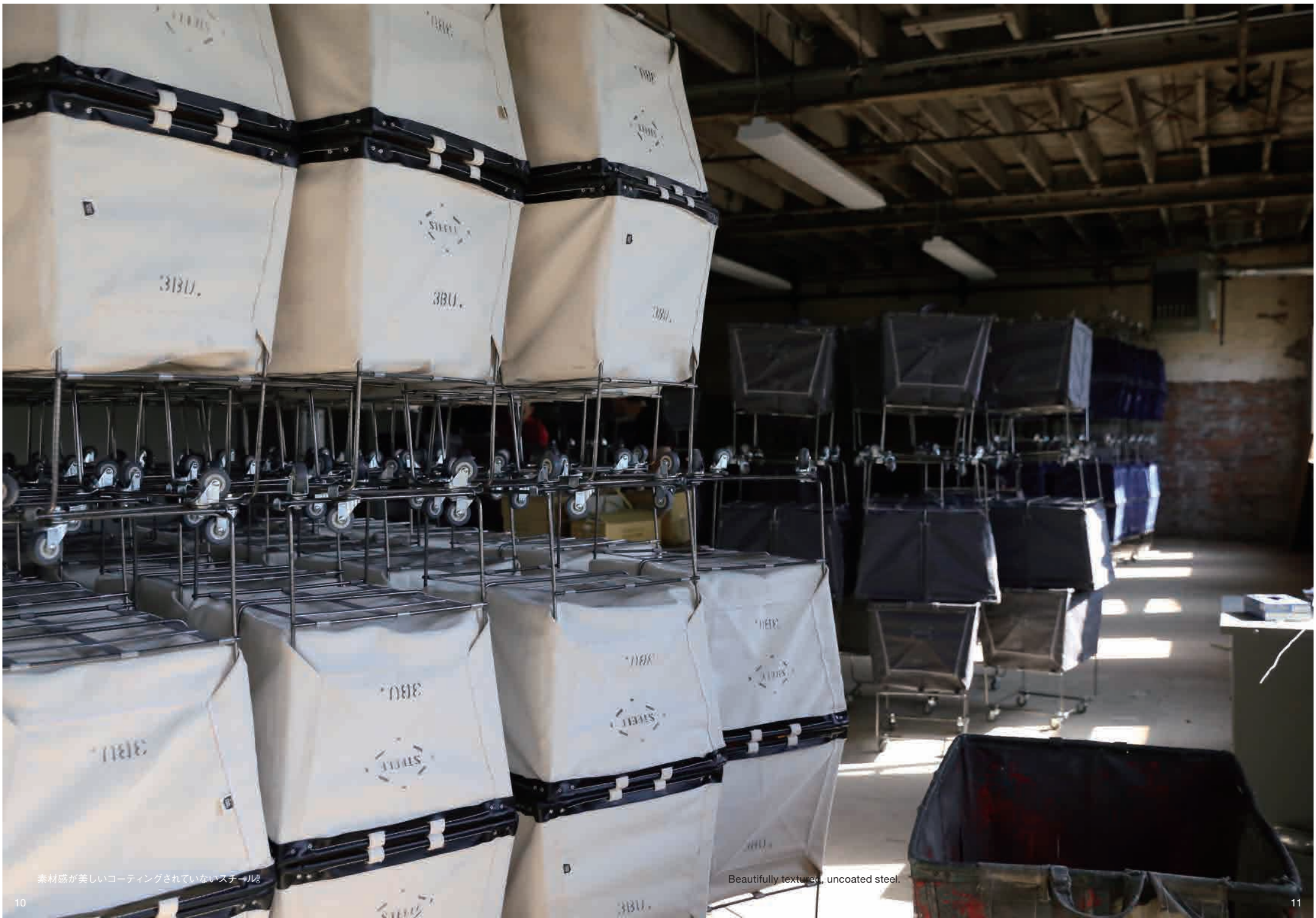
素材感が美しいコーティングされていないスチール