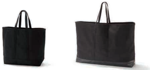
キャンバスバスケット・黒

* [02484699] 大 約幅107×奥行23.5×高さ94cm 税込 15,000円