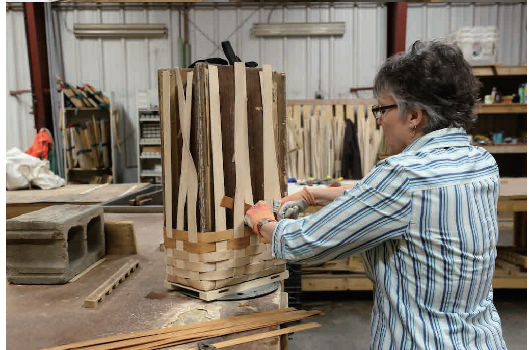
Long, thin strips of maple are soaked in water until soft. It is then fixed to the base and woven onto the frame. Once dry, the pack is surprisingly light and durable.